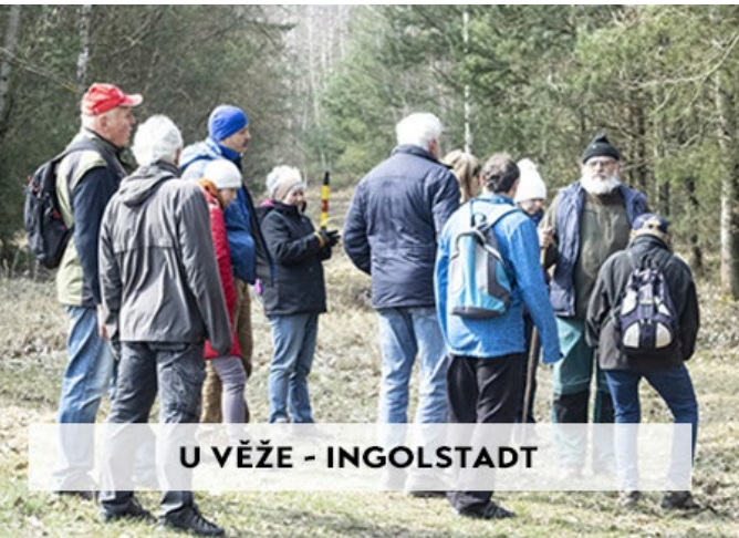
U VĚŽE - INGOLSTADT