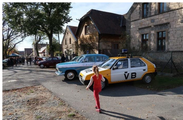
Historická vozidla v okolí hasičské zbrojnice

O posvícenskou sobotu bylo v Krupé rušno. V okolí hasičské zbrojnice byla Sborem dobrovolných hasičů Krupá ve spolupráci s Motoklubem Krupá, z.s. a Auto Place International, a.s. zorganizována výstava historických vozidel. Celkem bylo vystaveno přes 35 značek vozidel z éry Československa, z Anglie, Německa a Ameriky, jako např. Škoda, Tatra, Mercedes, Jaguar, Rolls-Royce, Saab, Trabant, VAZ, GAZ, Volha a další. Nejzajímavější a nejstarší byla předválečná Tatra 57 z roku 1938. Dále bylo vystaveno kolem 15 motocyklů, převážně značek Jawa, MZ, ale také Ducati, nebo krásný stroj značky Norton. Nechyběly ani traktory, a to Zetor 2011 a Zetor 25. Dále byla k vidění požární přenosná stříkačka PS 2/3 z roku 1963, PS3 z roku 1967, PS8 z roku 1959 nebo hasičská Tatra 148.