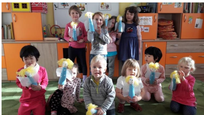
Vytvořené Andělky od dětí z MŠ Krupá

Listopadem nás provázely pohádky a na návštěvu za námi přiletěl drak Franklin. Děti zavedl do pohádkového světa a učil je spolupráci, toleranci a rozdílu mezi dobrem a zlem. Také začala již tradiční plavecká škola v Tuchlovicích.