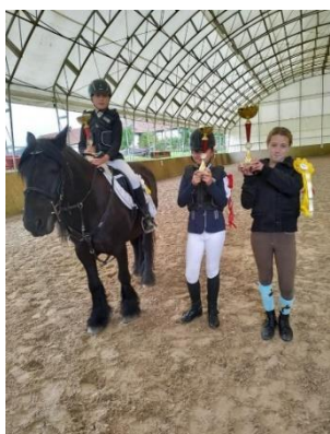
Vítězové Aura Cupu 2019 v kategorii zručnost