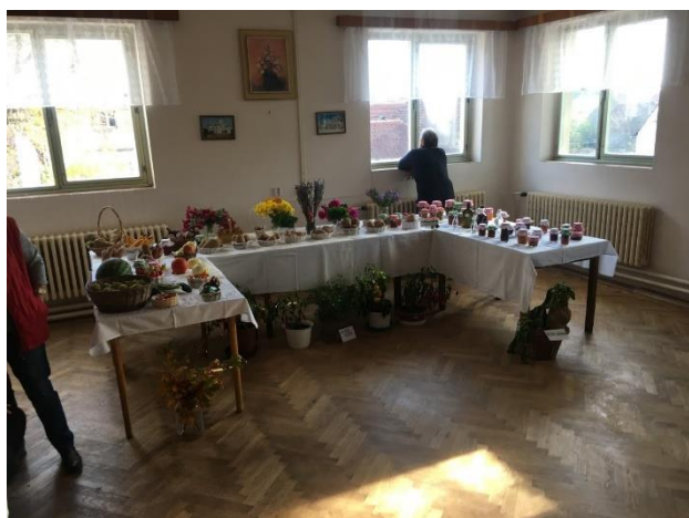
Vystavené plodiny a pochutiny Českého zahrádkářského svazu v Krupé