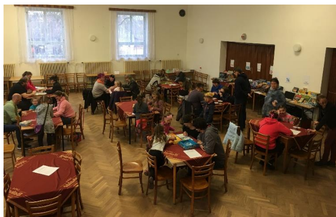
První z hráčů, kteří dorazili na 2. herní odpoledne v Krupé

V místní sokolovně se v sobotu 9. listopadu sešli již podruhé příznivci karetních a deskových her. V průběhu odpoledne a večera se na akci vystřídalo kolem šesti desítek hráčů. Spolku pro Krupou se podařilo zapůjčit mnoho pěkných her od vydavatelů Albi (Karak, Gobbit), Piatnik (Speed cups, Tik tak bum Family), Mindok (Rivalové, Krabčáci) a Dino (Farao, Dračí palác). Více než padesát herních a karetních titulů zaručovalo dobrou zábavu na celé odpoledne. Většinu z těchto „deskovek“ je možné si prohlédnout na https://www.pujcim.to/profil/spolek-pro-krupou-krupa .