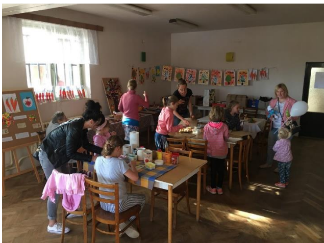
Výtvarné práce dětí z MŠ Krupá a tvořivá dílnička pro děti

V sobotu v rámci zahrádkářské výstavy probíhala i výstava výtvarných prací dětí z MŠ Krupá a tvořivá dílnička se zahradnickou tematikou. Děti mohly razítky z brambor potisknout papírové tašky. Vyplňovaly kvíz, ke kterému potřebovaly znalosti z krátkých informačních článků o ovoci a zelenině umístěných v sále výstavy nebo tvořily náhrdelníky s přívěsky ve tvaru jablka a hrušky.