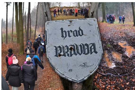
Koláž fotografií z turistické vycházky na hrad Pravda

Známostou cestou kolem mutějovického nádraží dojdeme na rozcestí. Silnice se tu větví ke Lhotě pod Džbánem a k mutějovickému nádraží. Lesní cestou a následně kolem trati přicházíme do Domoušic. Za Domoušicemi projdeme „polňačkou“, pak pod mostem k parkovišti pod hradem, odkud nás čeká poslední