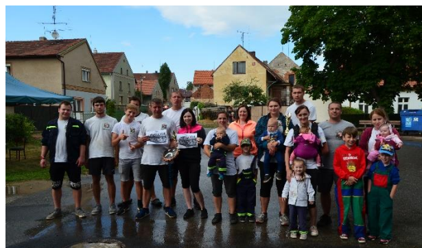
Členové SDH Krupá při netradiční hasičské soutěži v Krupé