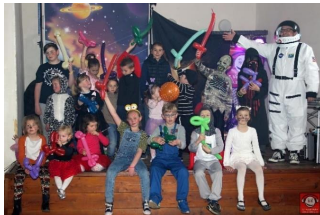
Karnevalové dovádění s kosmickou tematikou

kostýmu, obdržel balíček sladkostí od pořadatelů SDH Krupá.