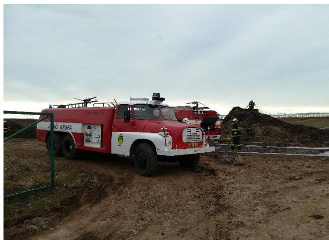
Hašení chmelinky v Chrástanech dne 4. 3.