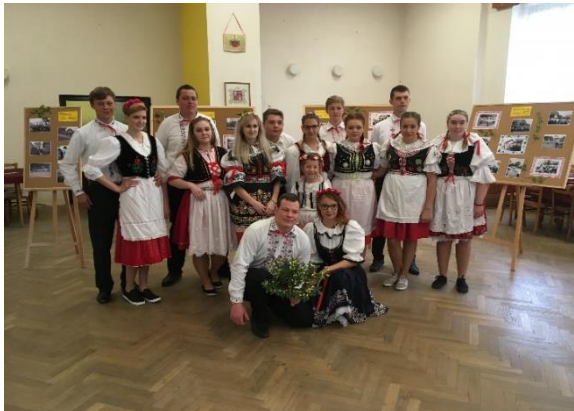
Májovníci před zahájením slavnostního průvodu po obci. V pozadí jsou vidět nástěnky s fotografiemi z výstavy.

Od sobotního rána vrcholily přípravy na průvod po obci a večerní zábavu. Tento rok panovalo velmi chladné počasí, které vygradovalo deštovosněhovou přeháňkou v čase zahájení průvodu. Stateční májovníci se přesto nenechali odradit, a i přes nepřízeň počasí a komplikaci s hudebním doprovodem, který jel místo na koňském povozu v dodávce, celý průvod dokončili. Po 17. hodině pak mladí zatančili staročeskou besedu.