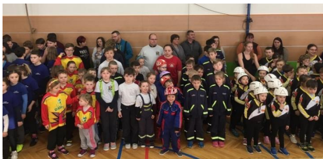
Naši mladí hasiči na Čisteckém uzlu

V sobotu 9. 2. se 11 mladých hasičů z Krupé zúčastnilo soutěže Čistecký uzel. Ve velmi silné konkurenci 170 dětí se všechna tři družstva našich hasičů umístila na 4. místě.