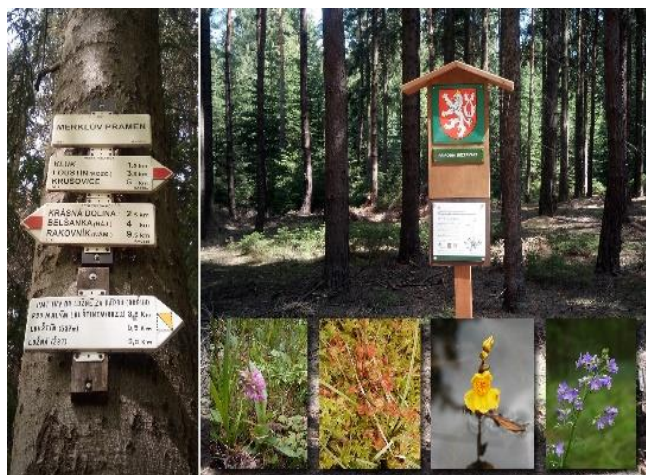
Vzácná flóra v okolí Pramenů Klíčavy

Předposlední květnovou neděli zorganizoval TJ Sokol Krupá komentovanou vycházku Přírodní rezervací Prameny Klíčavy a k bývalým lesním lázním Merkovka.