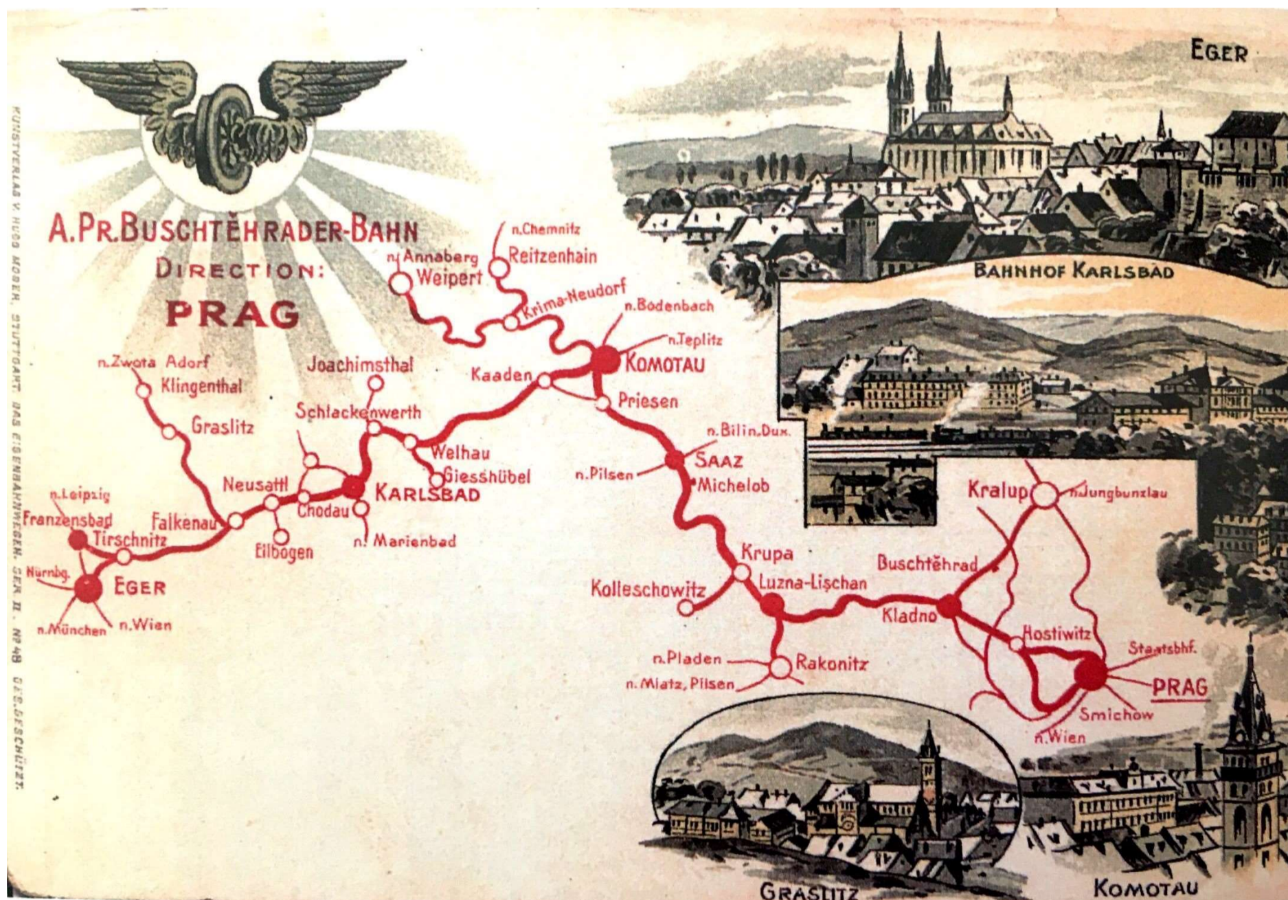
Obrázek 4 Kompletní železniční síť B. E. B. na dobové pohlednici z konce 19. století 2