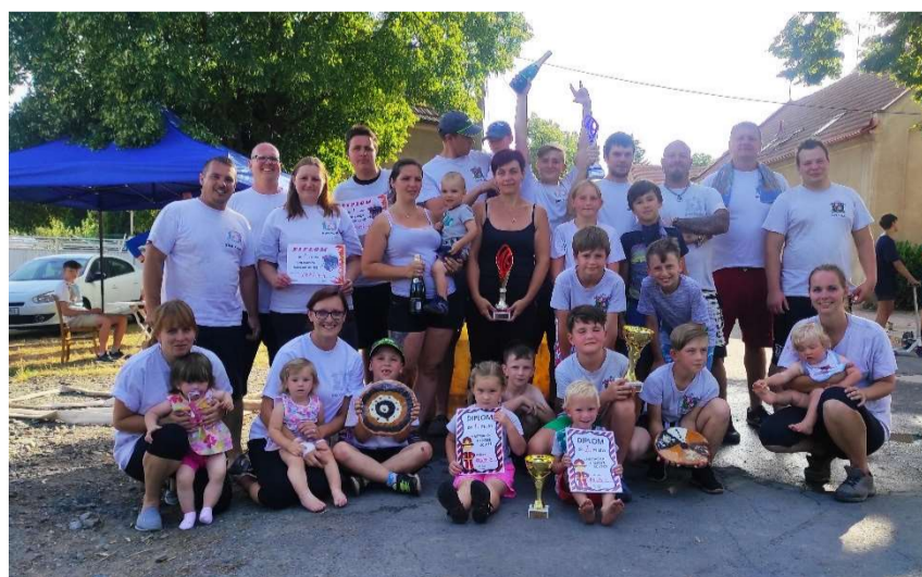
Obrázek 2 Naši hasiči po soutěžním klání

Dne 1.8.2020 SDH Krupá za podpory OÚ Krupá pořádal již 12. ročník netradiční požární soutěže, které se zúčastnila dvě dětská družstva SDH Krupá, dále tři družstva žen (1. místo obsadily ženy z SDH Krupá), a v kategorii muži bylo přihlášeno 5 týmů (1.místo obhájilo domácí družstvo). V této kategorii dále soutěžili muži z SDH Hamrska (okr. Jablonec nad Nisou), SDH Velká Chmelištná, SDH Krušovice a SDH Domoušice (okr. Louny). Soutěžilo se i v požárním útoku dvojic. Této soutěže se zúčastnilo celkem 8 dvojic včetně jedné dvojice žen z SDH Krupá.