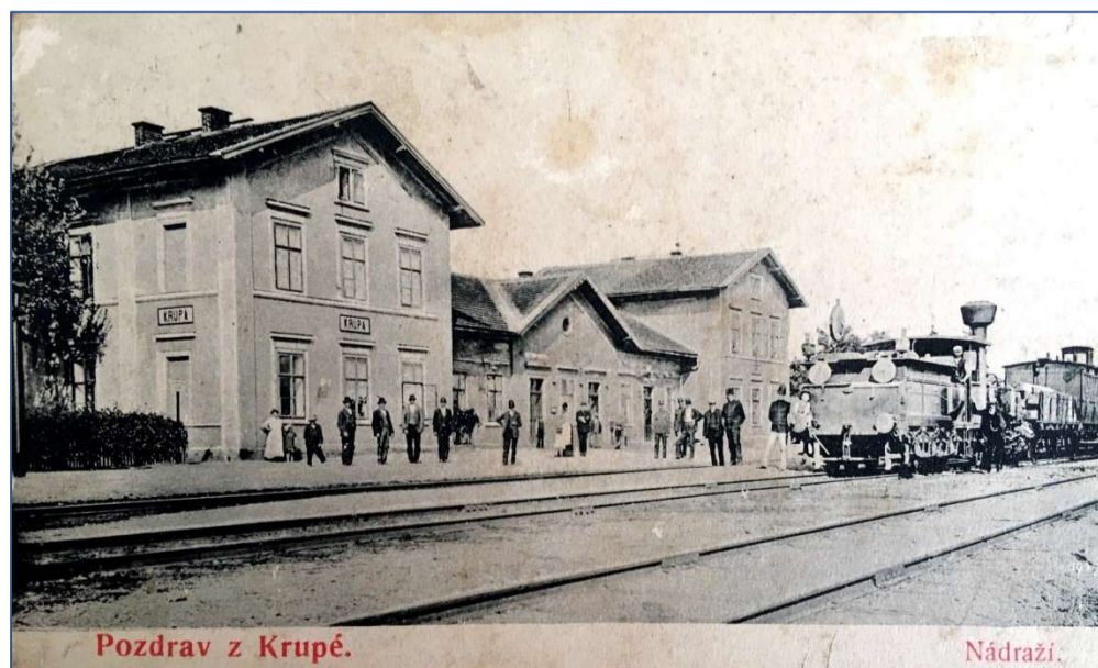
Obrázek 1 Pohlednice datovaná kolem roku 1905. Na snímku je krupské nádraží a „buštěhradská“ lokomotiva řady III a.

Budova nádraží Krupá byla postavena podle typového projektu inženýra Josefa Chvály jako výpravní budova II. třídy. I. třída označovala nejmenší, IV. třída největší typové budovy (např. budova v Lužné). Budova měla dvě čekárny, menší pro cestující 1. a 2. třídy, větší pro cestující 3. a 4. třídy. Původně byla přízemní, patrovou přístavbu na obou stranách dostala na přelomu 19. a 20. století. Svůj původní vzhled ztratila budova při opravě v roce 1980.